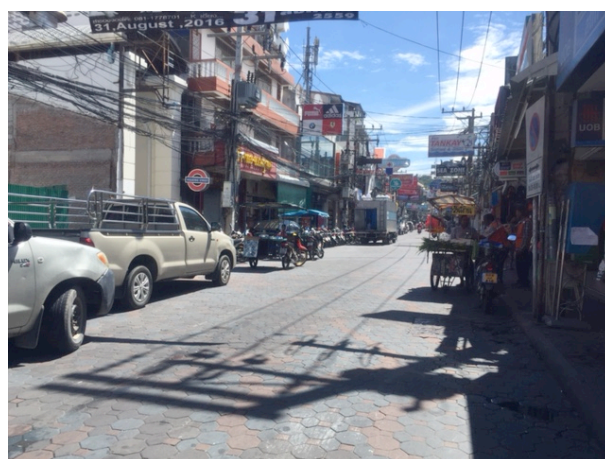
写真 4 タイ(パタヤ)の街並み