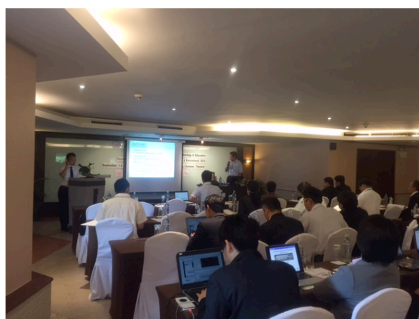
写真 2 講演発表の様子①