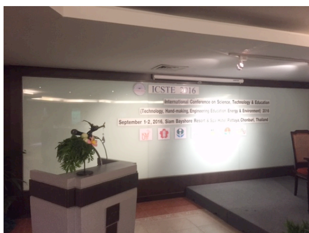
写真 1 会場