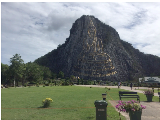
写真5 カオシーチャン