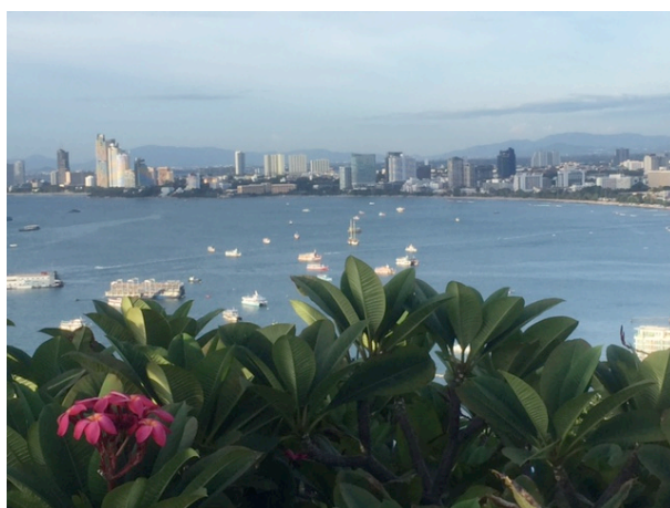
写真8 カオ プラ バートからの景色

2017年度は、タイ王国のノンカーイ (Nong Khai) が会場となる予定である。また、例年同様に Special issue も発刊される予定である。2016年度と同様に、可能な限り多くの国内研究者が協力し合うような体制を整えるとともに、積極的に研究成果を世界に向けて発信していく必要があると感じている。