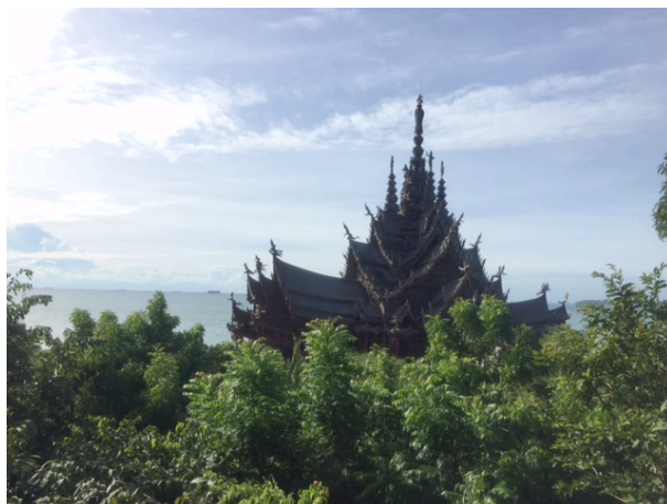
写真6 サンクチュアリーオブトゥールース