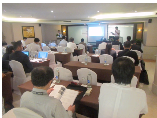
写真 3 講演発表の様子②